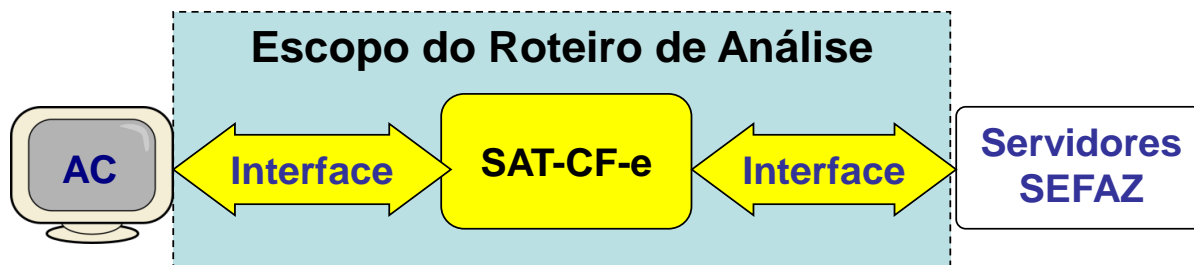
Figura 1 – Escopo do Roteiro de Análise

O roteiro de análise do software básico consiste na avaliação das funcionalidades do software, não contemplando a análise do código fonte e a identificação de riscos associados.